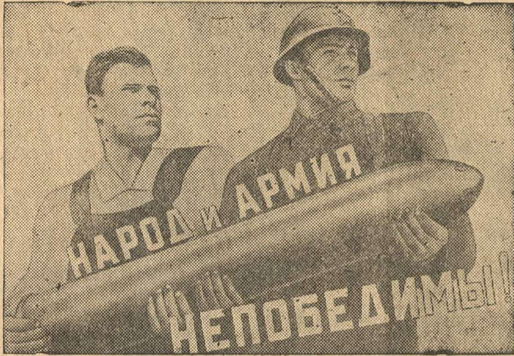
Рисунок художника В. Корецкого (Репродукция с плаката, выпущенного издательством «Искусство».