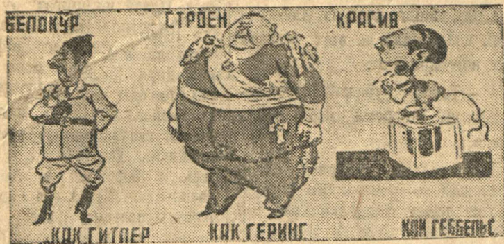
Рисунок Б. Ефимова (Окно ТАСС № 22).

Наглядное изображение «арийского» происхождения Согласно фашистской расовой теории истинный ариец должен быть: