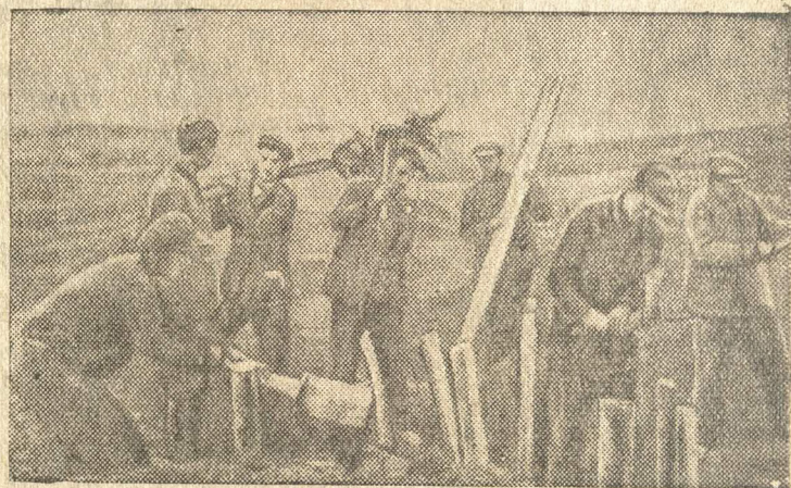
Колхозники строят противотанковые препятствия

Население прифронтовой полосы самоотверженно помогает бойцам Красной Армии в борьбе против фашистских захватчиков.