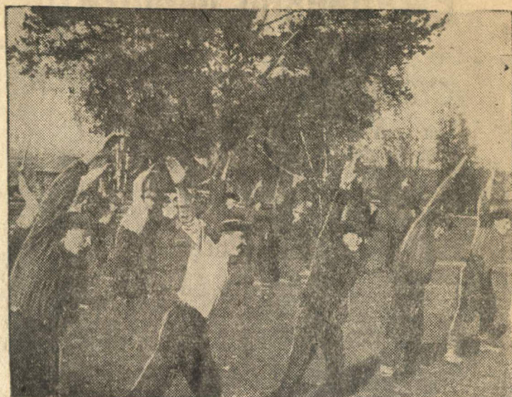
Молодежь села Хмелевицы изучает военное дело.