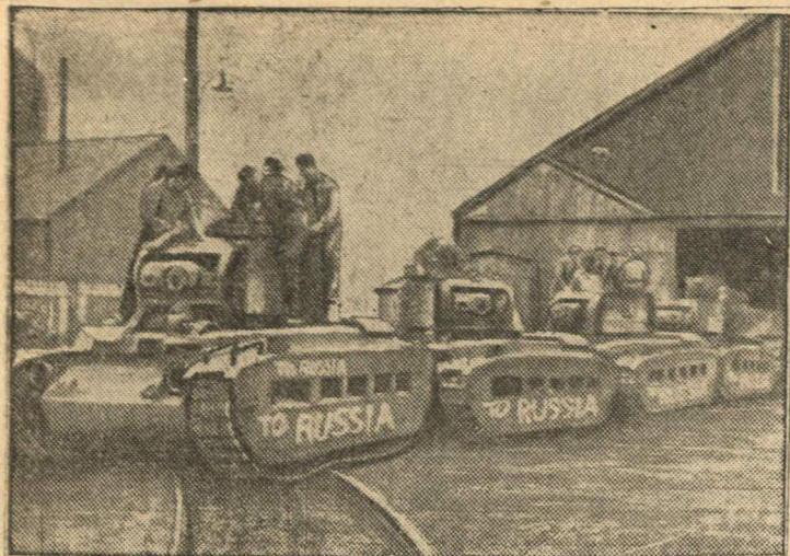
Неделя „Танки для СССР“ в Англии

Танки, выпущенные одним из английских заводов. Рабочие завода написали на каждом танке: «В Россию» (Передано по бильду из Лондона).