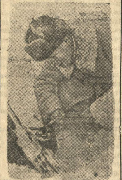
Сапер обезвреживает фашистскую мину.

Пытаясь задержать продвижение наших частей, отступающие немцы минируют дороги, тропинки, дома. Славные саперы очищают путь нашим войскам, умело разыскивая и обезвреживая мины, разставленные подлым врагом.