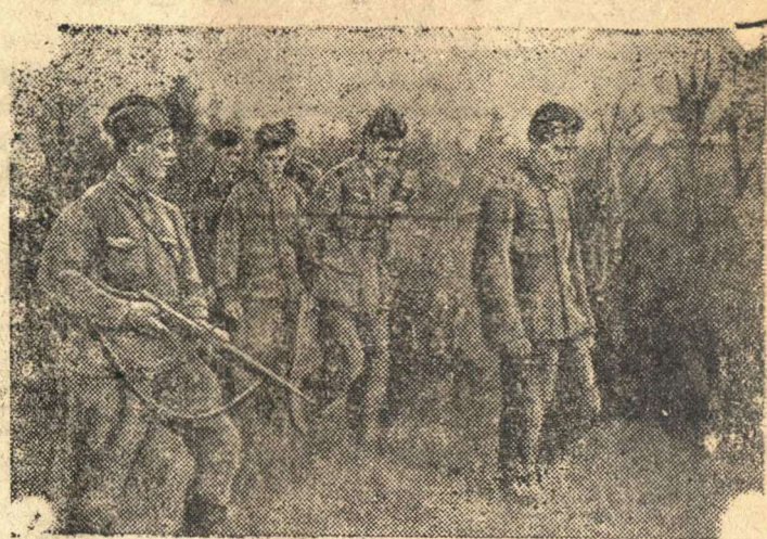
Группа гитлеровцев, захваченных в плен, направляется в тыл.