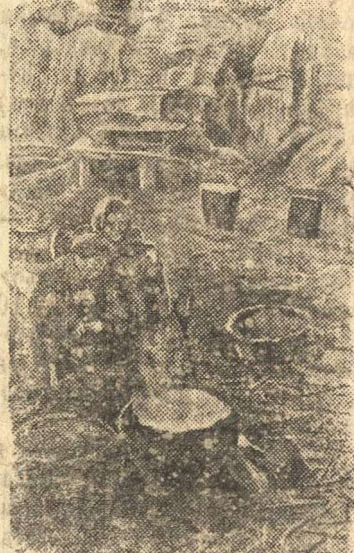
НА СНИМКЕ: Дети колхозницы Ивановой, вернувшись в свою деревню Захарово, Ржевского района, разрушенную немцами, ничего не нашли кроме разрухи, вепла и разбитого инвентаря.

На Центральном фронте захвачена в плен группа солдат 216 немецкого пехотного полка. Пленные обер-ефрейторы Вилли Зипман, Густав Штимбауэр и солдат Генрих Кеен рассказали: «Летом и осенью мы строили укрепления и готовились к зимним боям. И все же наступление русских застигло нас врасплох. Огромные опустошения произвела у нас русская артиллерия и тяжелые танки. Солдаты нашего батальона не выдержали и разбежались. Офицеры говорили, что нам удастся отсидеться, зарывшись в землю. Наступление русских рассеяло эти иллюзии. Теперь все понимают, что русские будут навязывать нам бои и не дадут покоя. Недавно в ротах зачитали приказ Гитлера — сражаться до последней капли крови. Этот приказ мы выслушали, как смертный приговор немецким войскам на Центральном фронте».