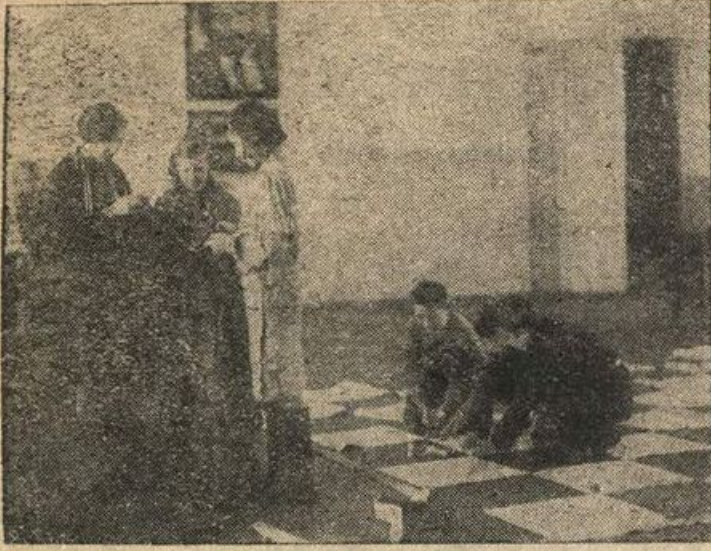
Школа им. Ленина. Готовятся к культурно-массовому собранию. (Готовят театрализованные шахматы).

новые программы, за систематизированные знания, за соединение обучения с производительным трудом, за коммунистическое воспитание можно успешно осуществить только тогда, когда школа будет правильно планировать свою работу: