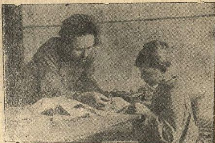
Канавинская школа „им. КИМ“. Час текстиля