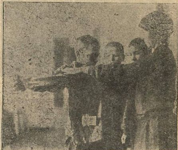
Школа им. Ленина. Ученики снабжаются промтоварами

В противовес этому мы рекомендуем руководствоваться инструктивно-методическим письмом о планировании работы в школе, разработанным Крайоно при участии курсантов краевых курсов лекторов.