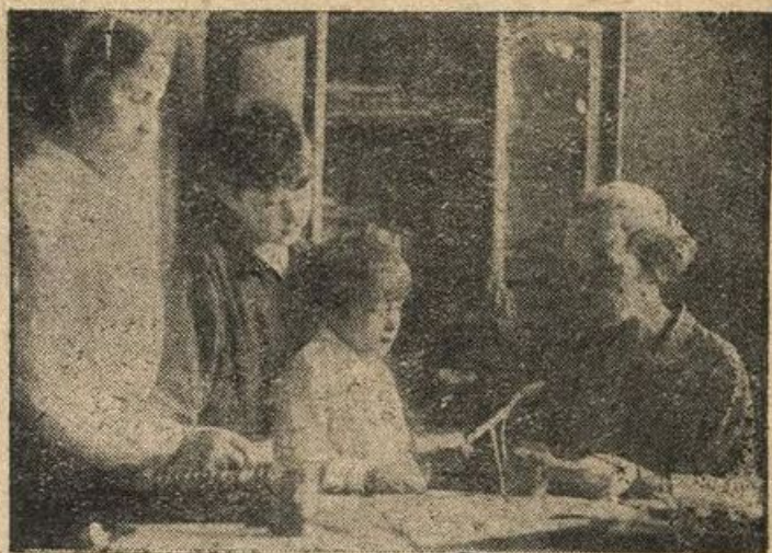
Получают талоны на завтраки.

Конкретные планы отдельных работников и школьных организаций, указанных в III разделе плана, представляются заведующему школой, который просматривает их (в течение не более 3 дней), делает на них соответствующие пометки, неудачно разработанные планы возвращает со своими указаниями на переработку и ставит на обсуждение школьного совета, методических и производственных совещаний. По мере рассмотрения эти планы подкалываются к общему годовому плану. Учебно-годовой план утверждается зав. школой, о чем он должен обязательно сделать пометку на плане.