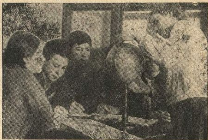
Школа им. X-летия Октябр. рев. Бригада работает по географии

Учительница — обращаясь ко всему классу: Сколько клеточек мы приготовили для твердых (5). Сколько клеточек для мягких (5). Сейчас я вам буду называть, а мальчик здесь, в верхнем ряду, будет писать твердые гласные звуки (они звучат очень твердо), а мягкие вы