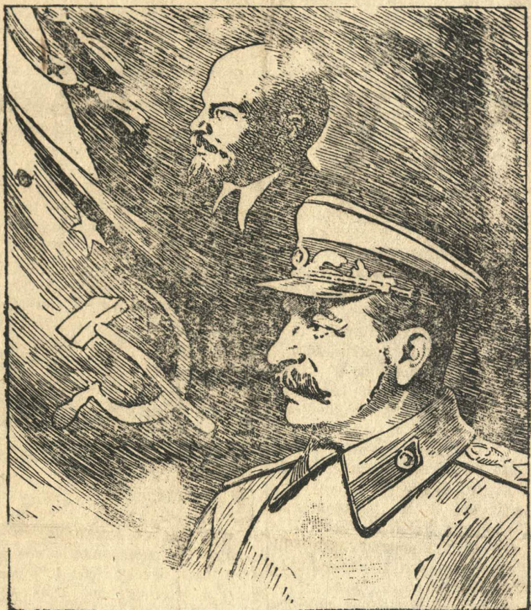
ПОД ЗНАМЯМ ЛЕНИНА, ПОД ВОДИТЕЛЬСТВОМ СТАЛИНА — ВПЕРЕД К НОВЫМ ПОБЕДАМ!

В народное хозяйство вливается большое пополнение из демобилизованных воинов. Со всех концов страны идут вести о новых трудовых подвигах. Вдохновенный победный и величественный перспективами мирного строительства советский народ делает все для валежания ран войны, для дальнейшего укрепления воен-