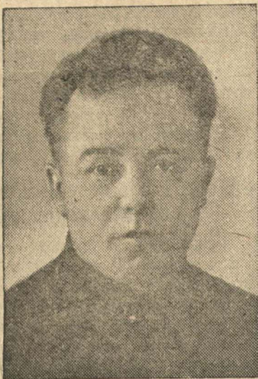
Секретарь Горьковского обкома и горкома ВКП(б) тов. Михаил Иванович Родионов, выдвинут кандидатом в депутаты Совета Союза Верховного Совета СССР по Горьковскому Ленинскому избирательному округу № 116.