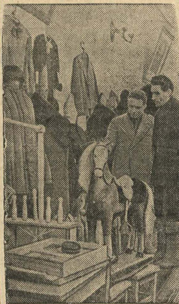
На выставке изделий, изготовленных из местного сырья Чкаловской областной промышленностью.