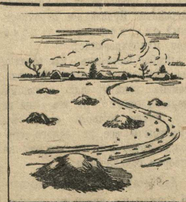
Как не надо складывать навоз в поле.