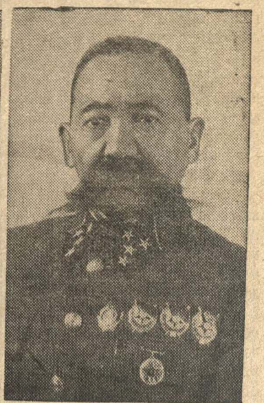
Генерал-полковник О. И. Гороодиков.