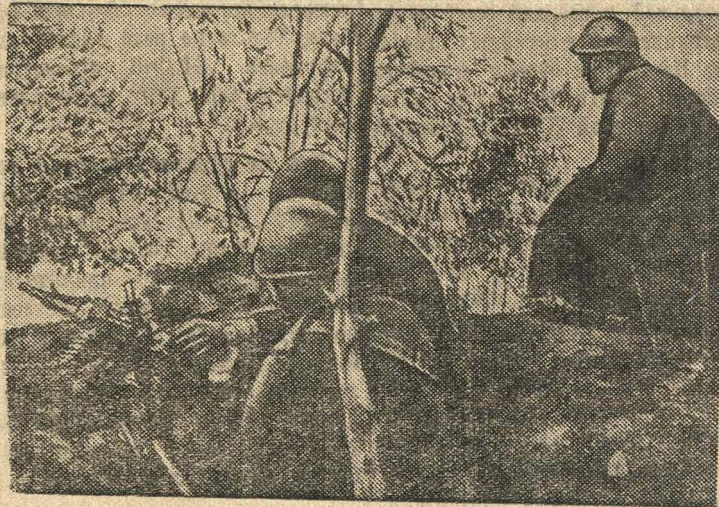
Итальянская огневая пулеметная позиция на греко-албанском фронте