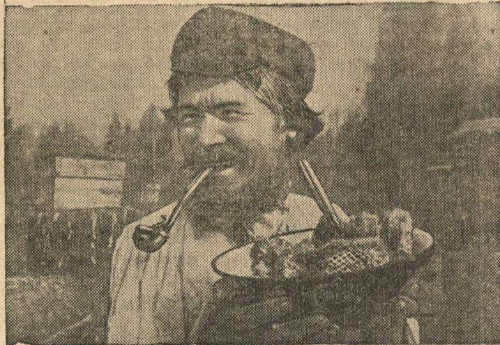
На пасеке колхоза имени Крупской, Ибресинского района, Чувашской АССР.

Дирекция МТС, хорошо зная обо всем этом, никаких мер к улучшению работы бригады не принимает, способствуя тем самым затягиванию весенних полевых работ. Ф. Гаранин.