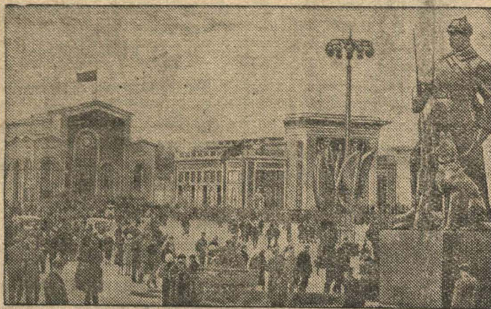
Площадь Колхозов в день открытия выставки.

На Всесоюзной сельскохозяйственной выставке