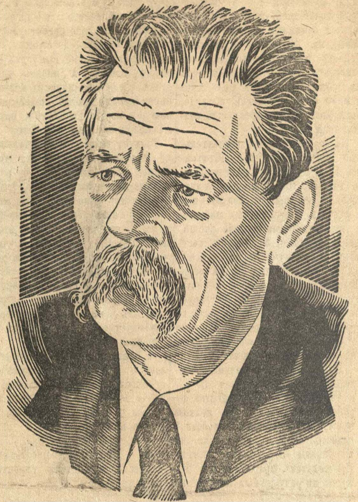
Алексей Максимович Горький.

Исключительно велика была любовь Горького к советскому народу, к стране, «Освещенной гением Владимира Ильича Ленина, где неутомимо и чудовищно работает железная воля Иосифа Сталина». Горячий патриот своей