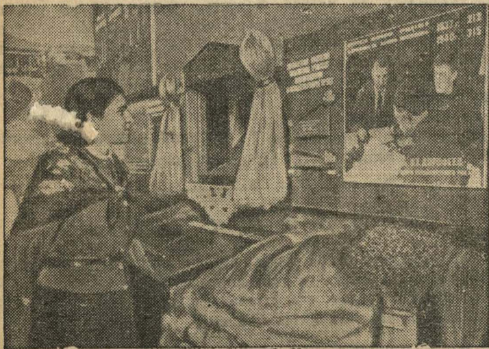
Стенд колхоза «1 мая», Краснохолмского района, Калининской области в павильоне «Лен, конопля, и новые дубяные культуры». Колхоз получил урожай льна в 1940 году по 7 центнеров с гектара на площади 44 га.

Всесоюзная сельскохозяйственная выставка.