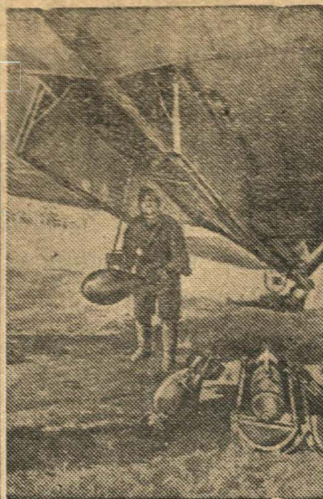
Перед боевым вылетом.