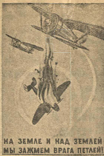
НА ЗЕМЛЕ И НАД ЗЕМЛЕЙ МЫ ЗАЖМЕМ ВРАГА ПЕТАЕИ!