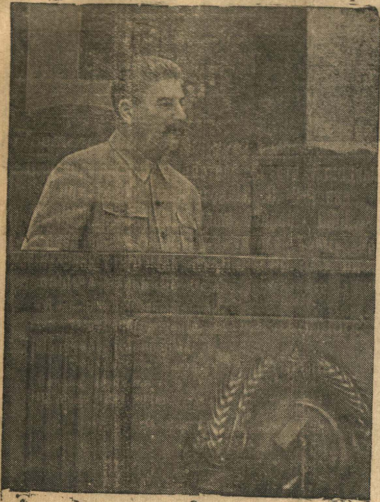
Товарищ И. В. Сталин (май 1941 г.).