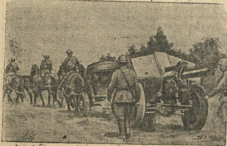
Советские артиллеристы продвигаются на передовые позиции.