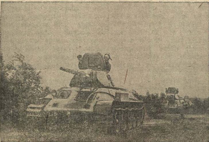
Танки выходят на выполнение боевого задания.