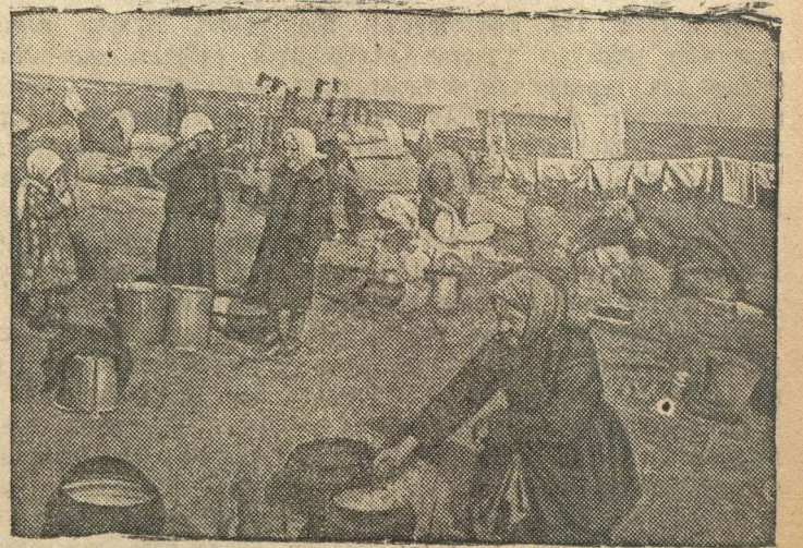
В местах, очищенных от фашистских бандитов.