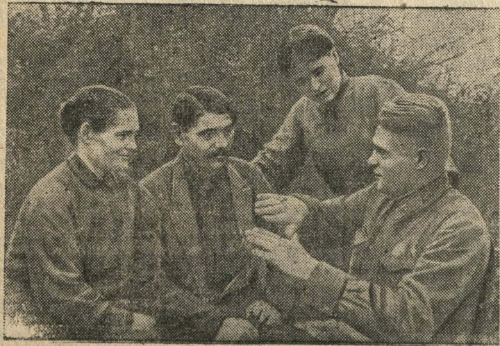
Герои Отечественной войны