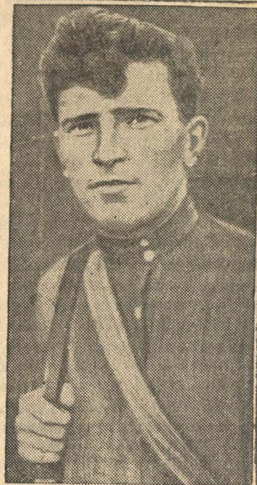
Сельская интеллигенция — активный участник партизанского движения.