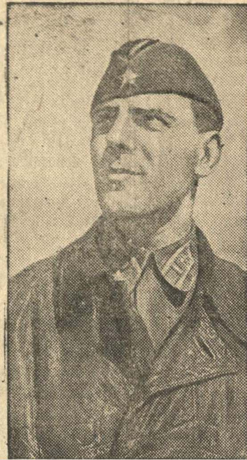
Герои отечественной войны.