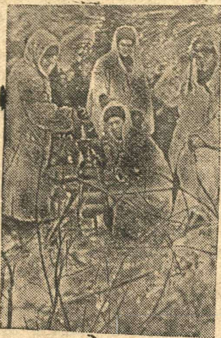
Действующая Армия (Западный фронт)

Успешным выполнением хозяйственно-политических задач, организацией всесторонней помощи фронту, усилением партийно-политической работы встретить открытие партийной конференции—таков долг каждой партийной организации, каждого коммуниста и всех трудящихся.