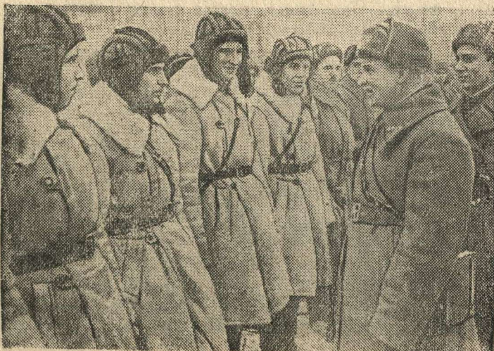
Командир гвардейской дивизии Герой Советского Союза колхозник тов. Лизюков беседует с гвардейцами-танкистами.

Героически сражаются с фашистскими бандитами танкисты 1 Гвардейской мотострелковой Московской дивизии.