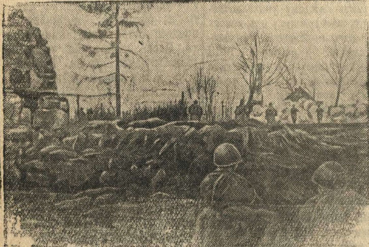
Действующая Армия. (Западный фронт)