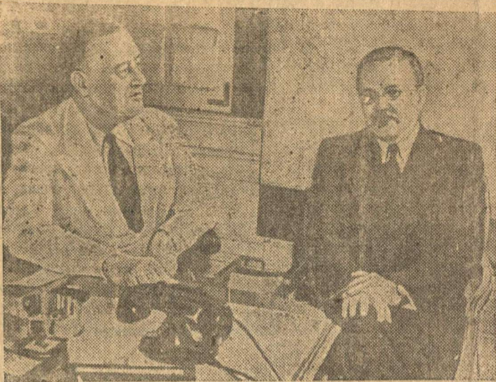
Президент США Франклин Д. Рузвельт и Народный Комиссар Иностранных Дел В. М. Молотов.