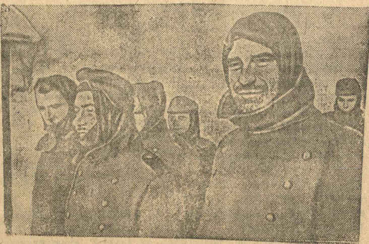
Пленные гитлеровские вояки.