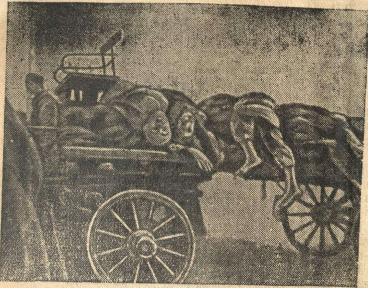
На снимке: Группы пленных красноармейцев, замученных фашистскими убийцами, вывозятся на свалку. (Фотогазета № 38 Главного Политуправления Красной Армии).

Кровавой дорогой прошли гитлеровцы по опустошенной Европе и временно оккупированным советским районам. Они безжалостно расстреливают и уничтожают местное население—стариков, женщин и детей, пленных раненых красноармейцев, вымещая на них свою звериную злобу.