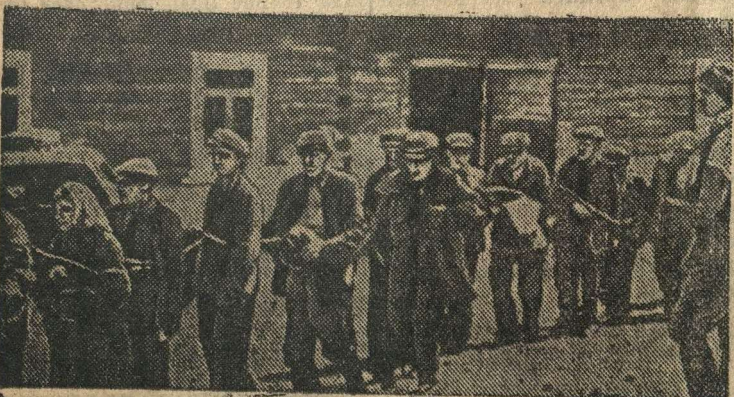
Ни в чем неповинных мирных советских людей немецкие изверги связывают веревками и гонят, как скот, на убой.