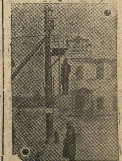
На снимке: Виселица на улице населенного пункта.

На снимке: сарай, превращенный немцами в кровавый гестаповский застенок. Здесь наши бойцы обнаружили десятки трупов замученных гитлеровскими палачами пленных красноармейцев.