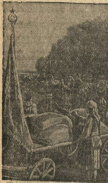
На снимке: обоз с подарками для бойцов РККА отправляется на заготовительный пункт.

За образцы социалистического труда колхозу вручено районное переходящее Красное Знамя. В ответ на награду колхозники в подарок Красной Армии отправили еще 11 центнеров зерновых.