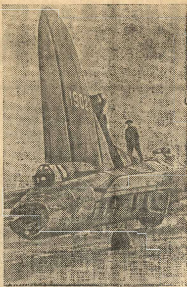
На снимке: Подготовка самолета «Летающая крепость» к вылету.