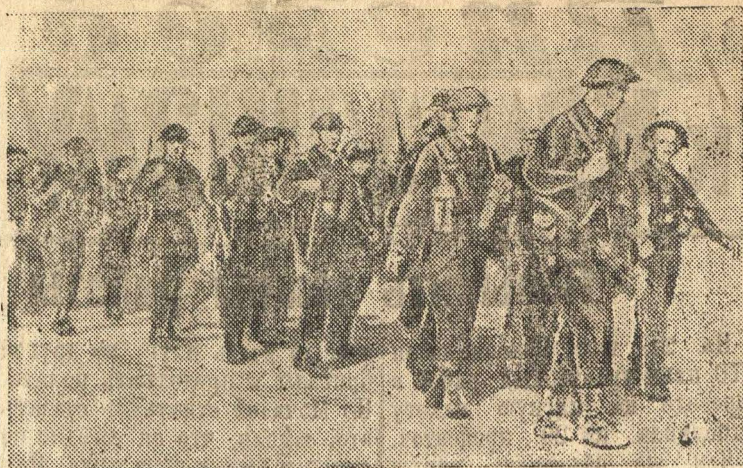
На снимке: Солдаты английского военно-воздушного полка продвигаются для занятия аэродрома.