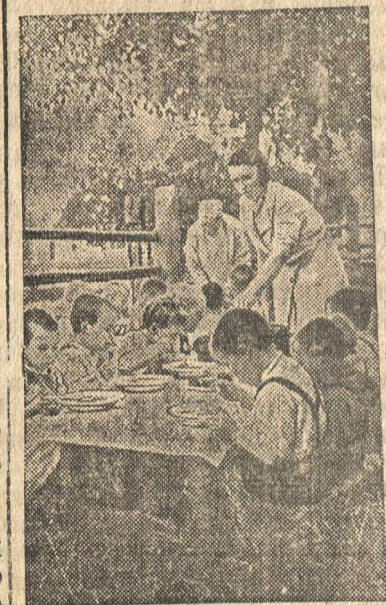
На время уборки в колхозе имени 2-ой пятилетки (Ивановский район, Ивановской области) организованы детские ясли.

По всем вопросам сессия приняла решение, мобилизующее трудящихся района на успешное разрешение хозяйственно-политических задач.