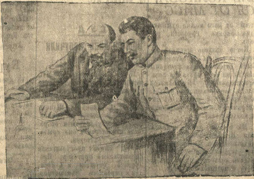
ЛЕНИН и СТАЛИН