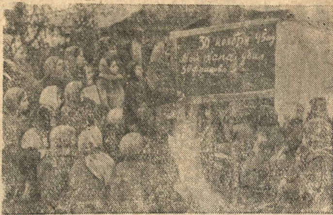
В тылу врага (Белоруссия)

Спасаясь от немцев, население многих деревень ушло в леса и живет под защитой партизан.