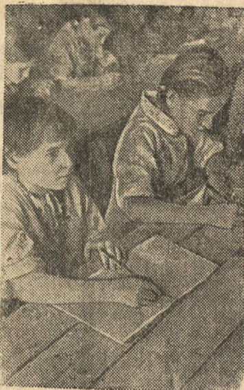
Восстанавливается жизнь в освобожденных районах Белоруссии.

Войска 1-го Украинского фронта заняли также города Глумач, Тысменица, Надворная, Делятин, Обертин, Сторожинец, Дунаевцы, Подгайцы, Косов, Куцы, Герца и много других населенных пунктов. В районе города Делятин пленен в полном составе 44 полк 18 венгерской легкопехотной дивизии вместе со штабом и командиром полка. Наши войска, блокирующие город Тарнополь, овладели большей частью города. За три дня уличных боев истреблено свыше 3000 немецких солдат и офицеров. Взято в плен 300 немцев.