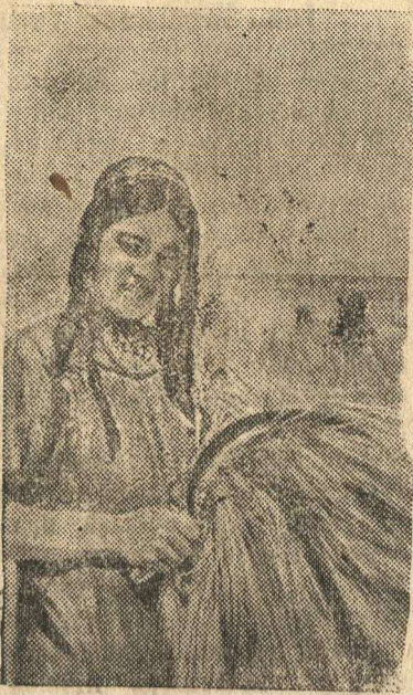
Уборка урожаев Турмении.