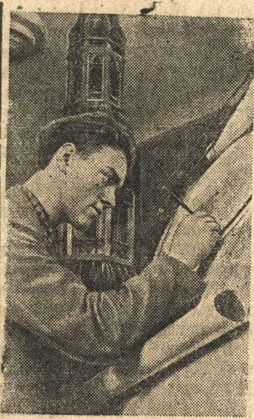
В освобожденной Латвии вновь широко открыты двери школ, вузов, академий для детей рабочих, крестьян и трудовой интеллигенции.

Только при полном использовании живого тягла в сочетании с хорошей работой тракторного парка район сумеет в ближайшие дни завершить сев.