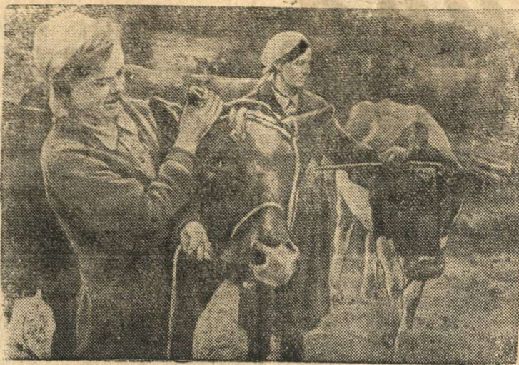
Колхозники — семья военнослужащих Ленинградской области получают от государства хороший скот.

После широкого обсуждения пленум принял развернутые решения по обоим вопросам.