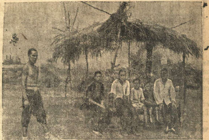
В Порт-Артуре. На снимке: семья китайского крестьянина.

ПОЛЯШОВ, КРАСИЛЬНИКОВ, КОЗЫРЕВ, СТРУГОВА, СУРИБОВ, КАШИН, ЕРМОШИН, ПАНФИЛОВ, КИСЕЛЕВ, КРУТОВ, БРОПЫЛЕВ, СЕРЕДИН, ЛЕБЕДЕВ, КУЗНЕЦОВ и другие.