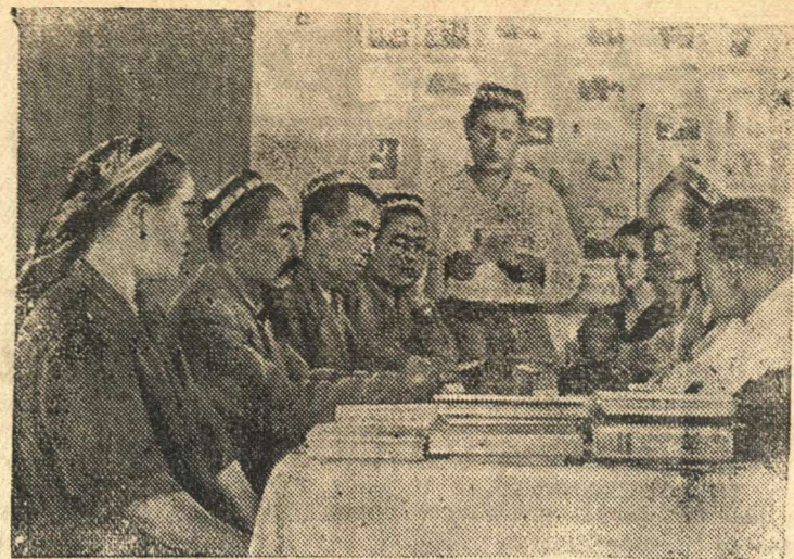
Парторг колхоза имени XVII партсъезда Карасуйского района Ташкентской области, консультирует колхозных агитаторов по избирательному закону.