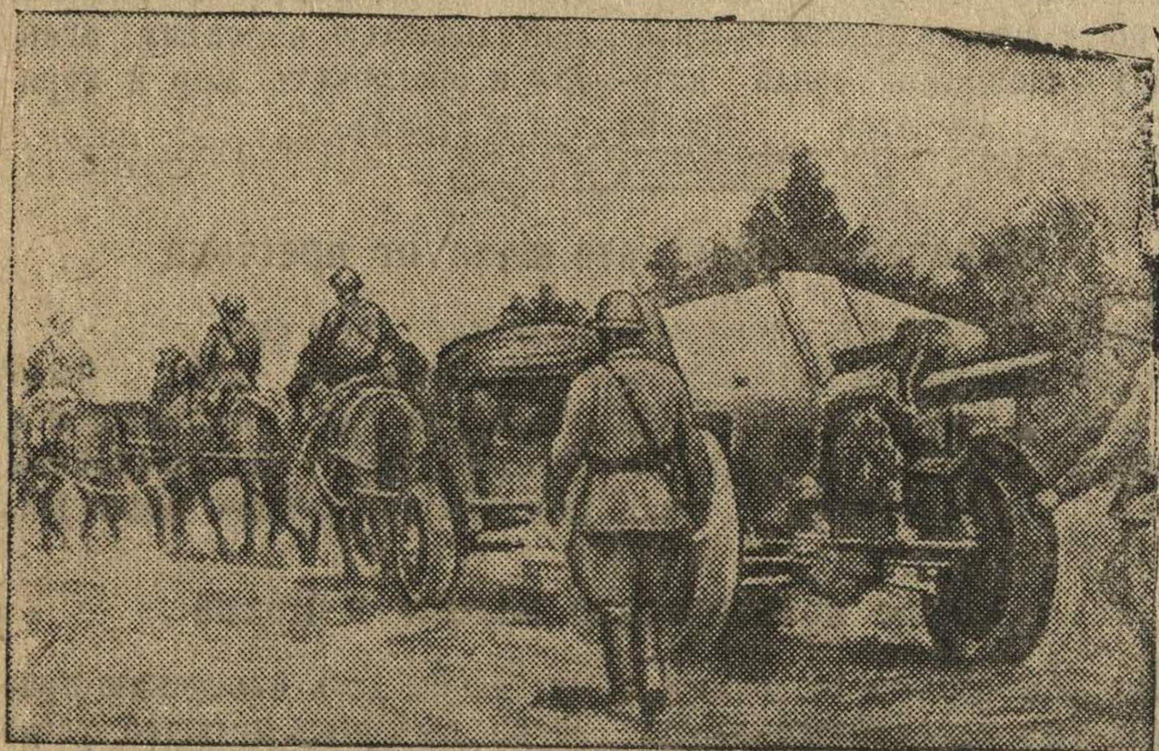
Советские артиллеристы продвигаются на передовые позиции.