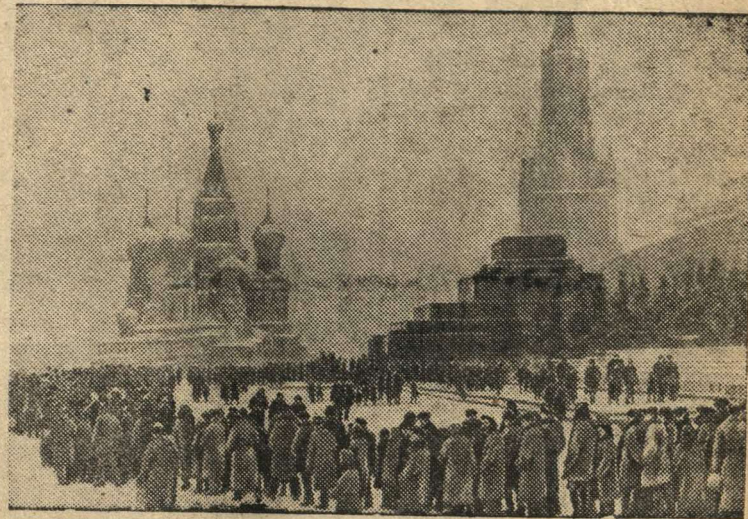
Трудящиеся у мавзолея Ленина.