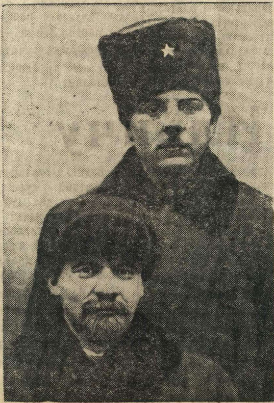
В. И. Ленин и К. Е. Ворошилов (1921 год).