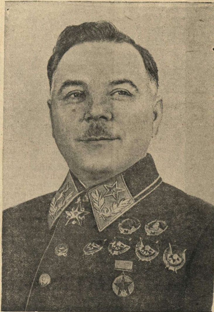
Заместитель Председателя СНК СССР Маршал Советского Союза К. Е. Ворошилов.

ской войны перед Советским государством встала задача — вооружить Красную Армию могучей передовой техникой, сделать ее способной разгромить любого врага, который посмеет напасть на Советский Союз.