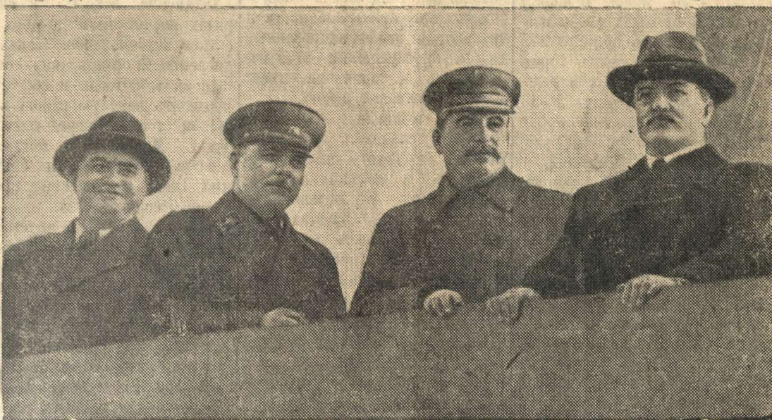
Справа налево: товарищи В. М. Молотов, И. В. Сталин, К. Е. Ворошилов, Г. М. Димитров на трибуне мавзолея.