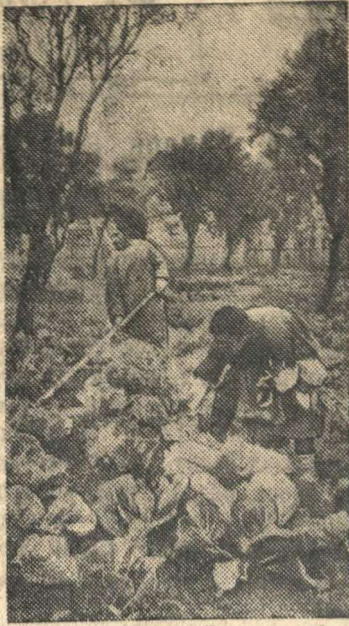
Прополка и окопка рассады капусты в подсобном хозяйстве обувной фабрики им. Берия (Тбилиси).

28 мая Киевское областное управление трудовых резервов начало выдачу путевок на предприятия выпускникам школ ФЗО. Первые путевки на работу в Майкопнефтекомбинат получили 15 штукатуров, окончивших школу ФЗО № 7, и 25 электромонтеров, выпущенных школой ФЗО № 31. (ТАСС)