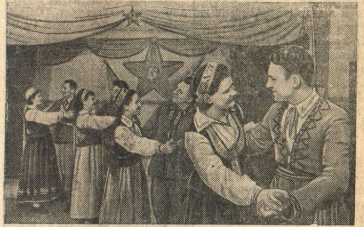
Ансамбль исполняет латышский народный танец «камолиньш»

Ансамбль народной пляски текстильной фабрики «Ригас мануфактура» готовится к декаде латвийского искусства в Москве.