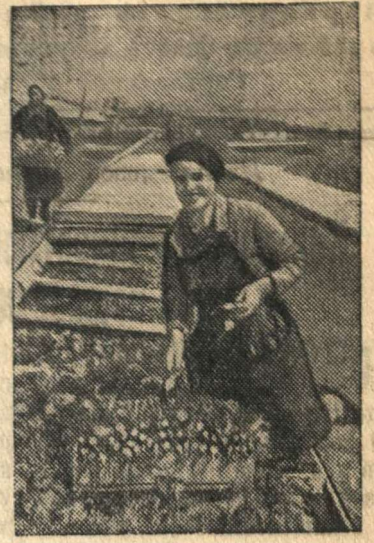
Сбор овощей в подсобном хозяйстве Сталинградского ордена Ленина завода «Красный Октябрь».