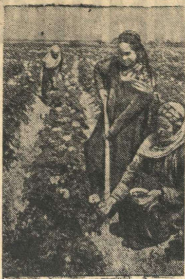
Колхоз «12 лет РККА» (Туркменская ССР) после уборки раннего картофеля сажит бахчевые.